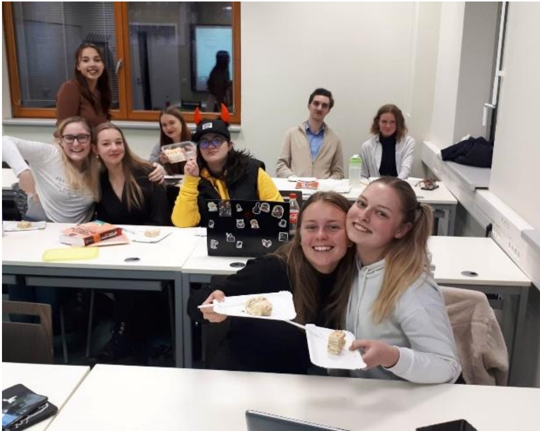
Katedra ruského jazyka a literatury na PdF MU

Velké odpoledne s ruštinou (studentská konference)