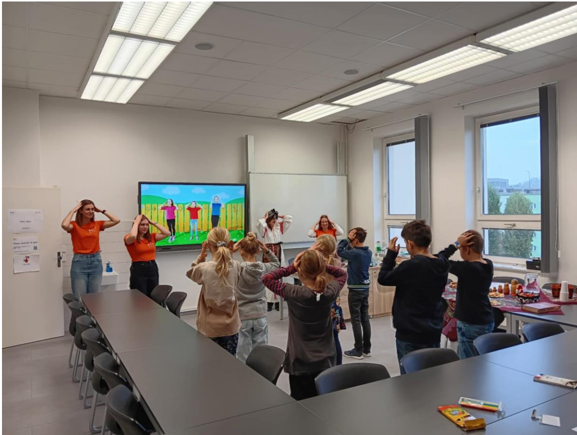
Katedra ruského jazyka a literatury na PdF MU